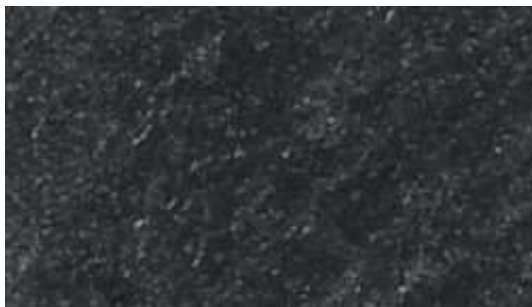
BP 667 (Standard til køkken)