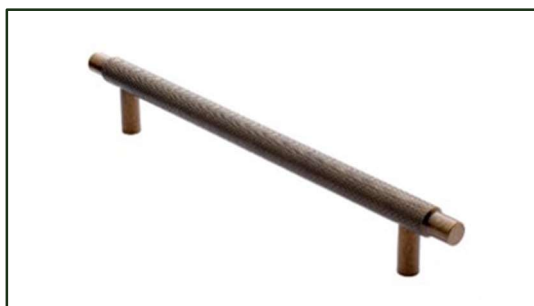
G1301M KNOP BØRSTET MESS