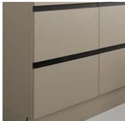
H22 SORT (TILVALG)