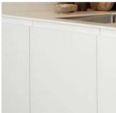
H22 HVID (STANDARD)