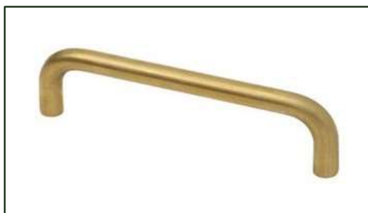
G1301M KNOP BØRSTET MESS