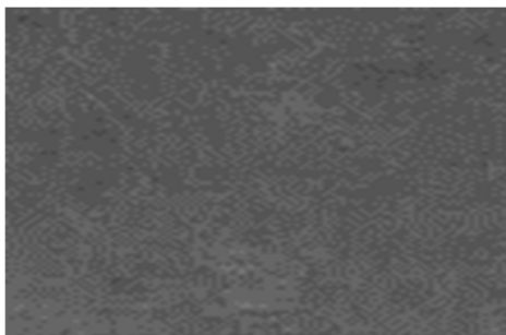
BP 601 (Standard til køkken)