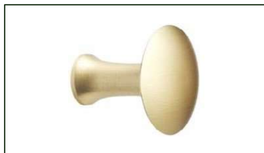
G1301M KNOP BØRSTET MESSING