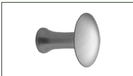
G1301B KNOP BØRSTET STÅL LOOK