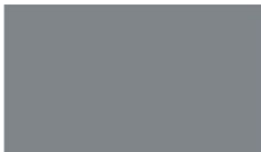
LAVA PURE LAMINAT