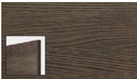
NORDIC RAW EG