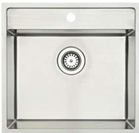
LAVABO NEXUS 60 RUSTFRI STÅL UNDERLIMET 530X500 MM (490X380)