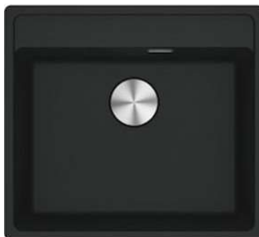
FRANKE MRG 210-52TL FRAGRANIT SORT UNDERLIMET 553X503 MM (520X400)

MATERIALEBESKRIVELSE DATERET 29.02.2024 DER TAGES FORBEHOLD FOR EVT. ÆNDRINGER OG TRYKFEJL. DE VALGTE MATERIALER OG PRODUKTANGIVELSER I MATERIALEBESKRIVELSER ER ET UDTRYK FOR ET GENERELT KVALITETSLEVEL. SÆLGER ER BERETTIGET TIL UDEN VARSEL - EKSEMPELVIS SOM FØLGE AF, AT MATERIALET ELLER PRODUKTET UDGÅR HOS LEVERANDØREN - AT OMBYTTE ELLER ÆNDRE TIL EN ANDEN PRODUCENT, ET ANDET MATERIALE ELLER ET ANDET PRODUKT, DER HAR SAMME EGENSKABER OG KVALITET SOM I DET MATERIALEBESKRIVELSEN ANFØRTE MATERIALE ELLER PRODUKT. SE I ØVRIGT MERE I PROJEKTETS KØBSAFTALER PUNKT 3.