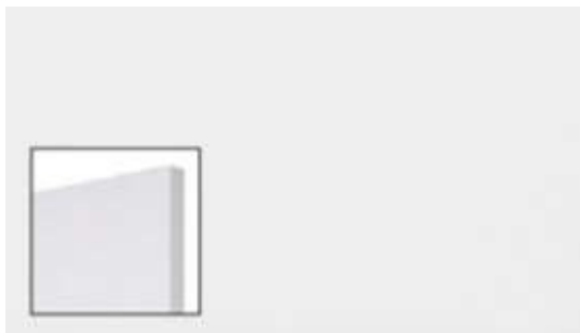
HVID VISION LAMINAT