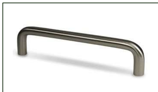
G1301M KNOP BØRSTET MESS